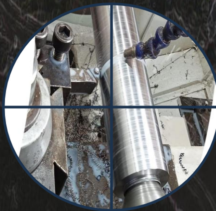
CASING HARGER DE 7"