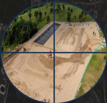
CONSTRUCCIÓN DE PLATAFORMAS